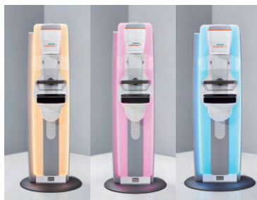
イルミネーション点灯時イメージ