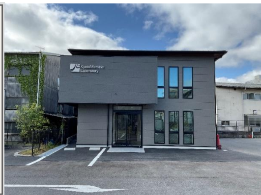
新社屋(管理棟)正面